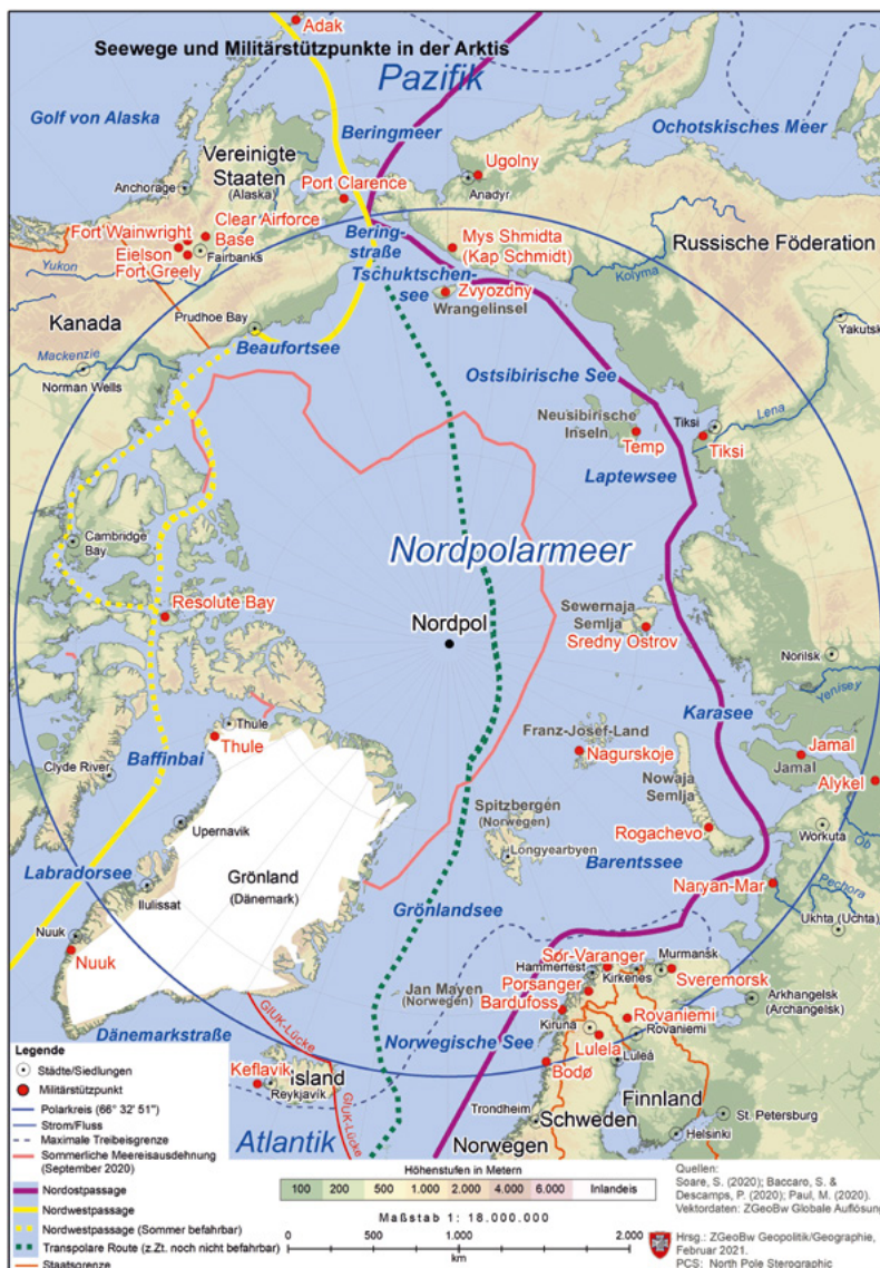
△ Abb. 4: Seewege und Militärstützpunkte in der Arktis

posten des norwegischen Militärs mit einer Wetterstation über 500 km nordöstlich von Island zwischen Grönland und Norwegen liegt (siehe Abb. 4), Unterstützungsmaßnahmen für den dortigen Flugplatz durchgeführt (McGWIN 2020; REUTERS 2020). Weitere Investitionen in die lokale Infrastruktur, zu der auch ein Hafen gehört, wurden im Jahr 2024 durch Norwegen bekanntgegeben (STAALSEN 2024). Dies alles verdeutlicht die strategische Präsenz der NATO in einer arktischen Meeresregion, die für die russische Nordflotte den Zugang zum Atlantik darstellt. Zusätzlich werden US-Streitkräfte laut Medienberichten künftig auch Truppenübungsplätze und Flugplätze in Norwegen, Finnland und Schweden nutzen. Die im Februar 2024 unterzeichneten Kooperationsabkommen sollen eine deutliche Botschaft an Moskau senden, das seit einigen Jahren Gebietsansprüche am Nordpol geltend macht (TABLE MEDIA 2024). So sollen den USA beispielsweise Zugang zu acht weiteren Einrichtungen