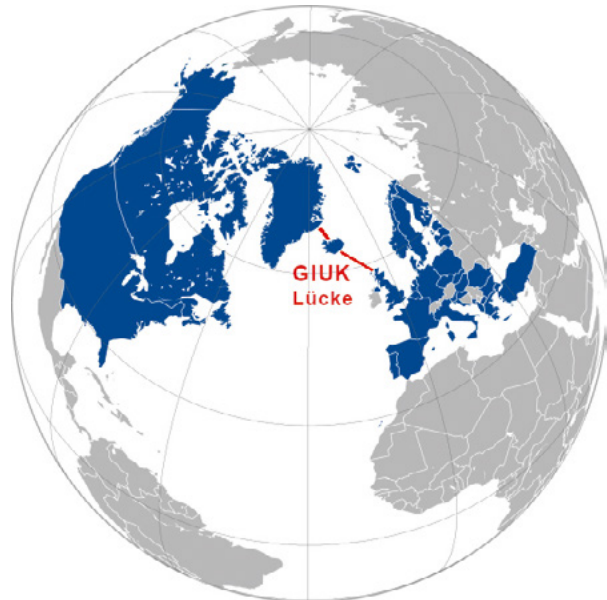
△ Abb. 3: Lage der GIUK-Lücke (rot) umgeben von den NATO-Mitgliedsstaaten in blau

auch die auf dem Meeresboden verlaufende kritische Infrastruktur, vor allem Kommunikationsleitungen, empfindlich oder sogar dauerhaft beeinträchtigen.