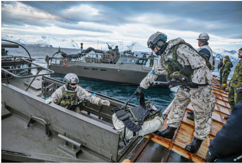
△ Finnische Soldaten während der Übung Steadfast Defender im März 2024

es bemerkenswert, dass Russlands Invasion Finnland und Schweden dazu bewegt hat, von ihrer jahrzehntelangen Politik der offiziellen militärischen Neutralität abzurücken.