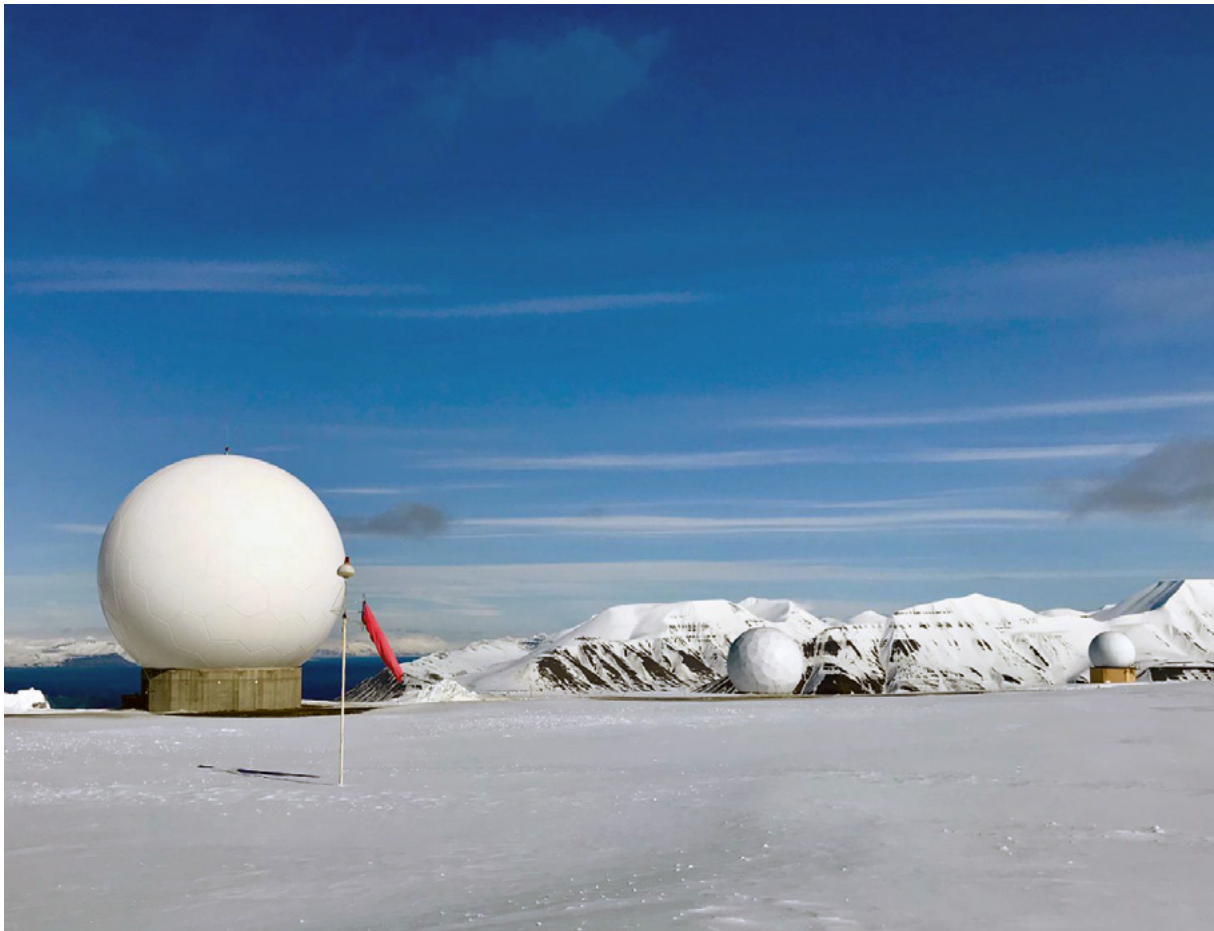
△ Svalbard Satelliten Station

Somit hat der Krieg in der Ukraine die Sicherheitslage in der Arktis verschärft und zu einer erhöhten Militarisierung sowie zu gestiegenen geopolitischen Spannungen geführt, was der NATO-Beitritt Schwedens und Finnlands verdeutlicht. Die langfristigen Auswirkungen auf die regionale Stabilität und Zusammenarbeit bleiben jedoch abzuwarten und erfordern eine sorgfältige Beobachtung und Analyse.