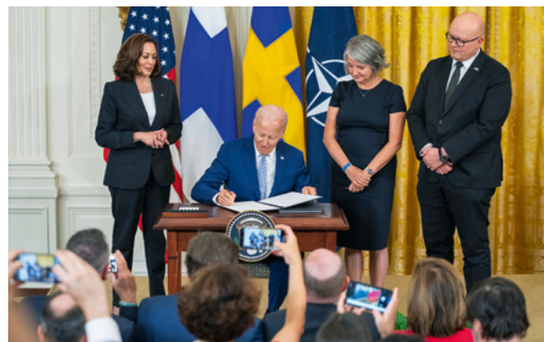
△ US Präsident Biden unterzeichnet die Ratifizierungsurkunden zur Genehmigung der NATO-Mitgliedschaft Finnlands und Schwedens am 9.8.2022.

und Gebieten in Norwegen gewährt werden. Bislang konnten die USA dort vier Einrichtungen und Gebiete militärisch nutzen. Zu den neu vereinbarten Standorten gehören der Flugplatz Andøya, der Flugplatz Ørland, der Marinestützpunkt Haakonsværn, die Luftwaffengarnison Værnes, der Flugplatz Bardufoss, die Garnison Setermoen mit Schieß- und Übungsplatz, der Osmarka-Cavernen-Komplex und der Tankstellenkomplex Namsen. Zusammen mit den bereits genutzten Einrichtungen und Gebieten, darunter die Flugplätze Rygge, Evenes und Sola sowie die Marinestation Ramsund, haben die amerikanischen Streitkräfte nun Zugang zu insgesamt zwölf Einrichtungen und Gebieten in Norwegen (BUSINESS PORTAL NORWEGEN 2024). Weiter wird berichtet, dass im Dezember 2023 nach Schweden und Finnland auch Dänemark ein bilaterales Abkommen für eine Verteidigungszusammenarbeit mit den Vereinigten Staaten geschlossen haben. Diese Vereinbarungen sehen die Schaffung von 17 Einrichtungen und Gebieten in Schweden, 15 in Finnland und drei in Dänemark vor, die für militärische Zwecke genutzt werden können. Grönland und die Färöer-Inseln, die beide zum dänischen Königreich gehören, sind jedoch nicht Teil des Abkommens (HANDELSBLATT 2023; BUSINESS PORTAL NORWEGEN 2024).