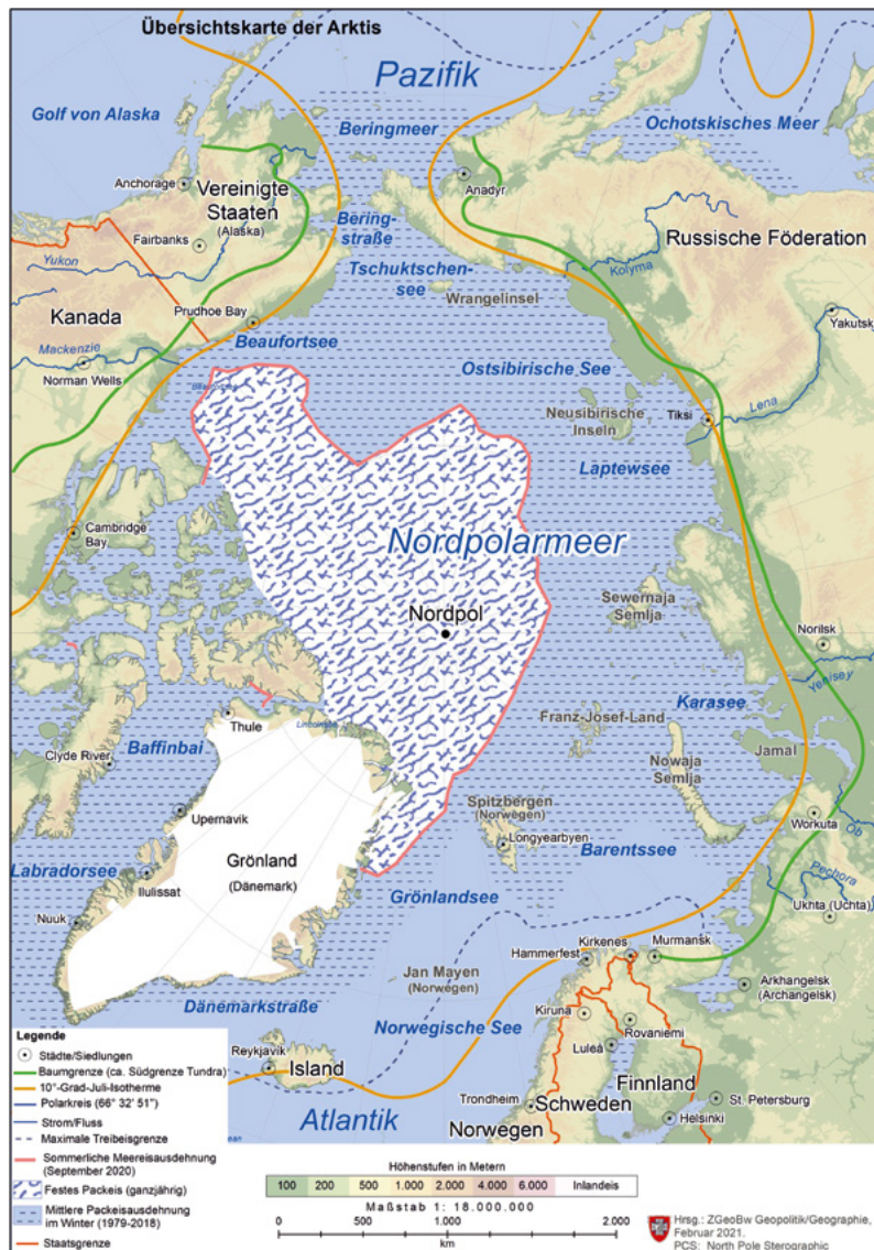
△ Abb. 1: Übersichtskarte der Arktis

seinem dortigen Wirkungsbereich günstig beeinflussen. Das einzige multilaterale Gremium, welches sich ausschließlich mit der Arktis befasst, stellt der Arktischen Rat (AR) dar, dem neben den fünf arktischen Anrainerstaaten (Dänemark, Kanada, Norwegen, Russische Föderation, Vereinigte Staaten von Amerika) und Island auch Schweden und Finnland angehören. Hinzu kommen noch ständige Teilnehmende, welche die indigenen Völker der Arktis vertreten. Deutschland und weitere zwölf Nichtanrainer (China, Frankreich, Großbritannien, Italien, Indien, Japan, die Republik Korea, Niederlande, Polen, Schweiz, Singapur und Spanien) sind Beobachtende im Arktischen Rat. Der Rat ist das führende zwischenstaatliche Forum für die Zusammen-