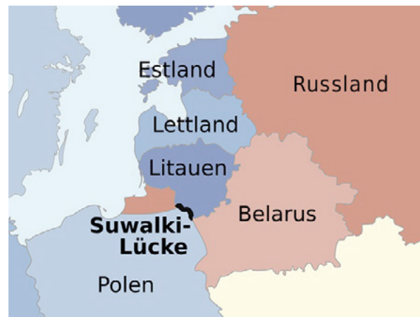
△ Abb. 5: Lage der Suwalki-Lücke

der NATO werden. Denn diese Region ist nur schwer zugänglich für westliche Streitkräfte und ihre Verteidigung hängt wohl entscheidend davon ab, ob die NATO die Kontrolle über die Barentssee ausüben kann.